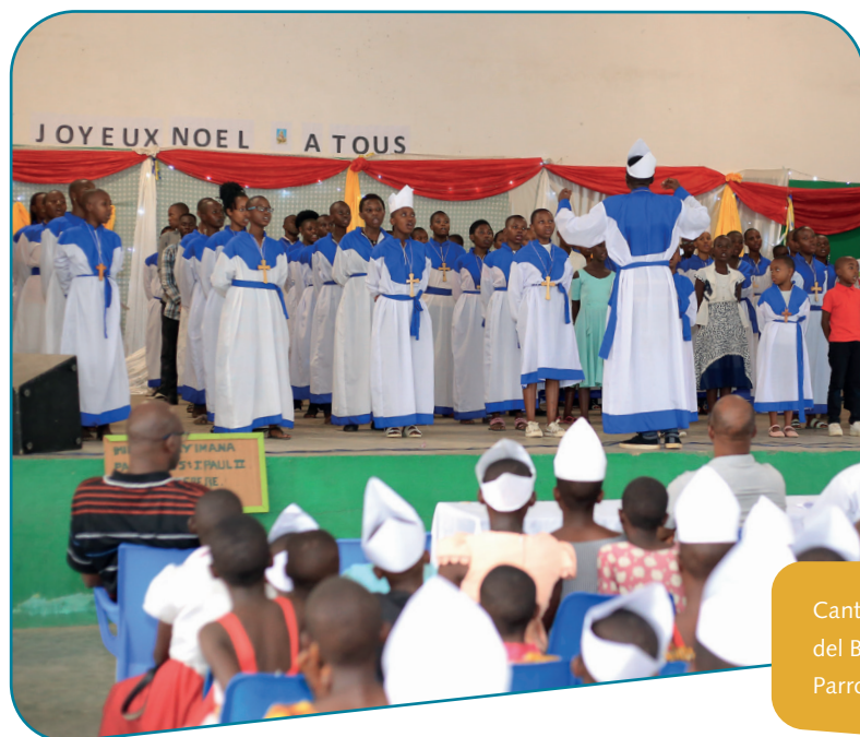
Cantori della Stella del Burundi, Parrocchia di Butere

Un esempio di formulario « Diritto all'immagine » è disponibile su www.missio.ch .